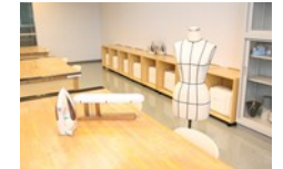
手工芸、染色等様々な用途の実習室