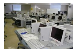
パソコンの勉強ができる実習室