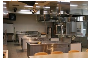
料理研究のための実習室