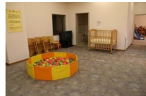
研修中等の子どもの居室スペース