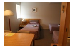
各室バス・トイレ完備 アメニティ：浴衣、石けん、シャンプー、リンス、歯ブラシ、 タオル、バスタオル