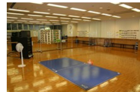
ダンス、エアロビクス等の運動に最適