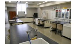
理科関係の実習に最適な実習室