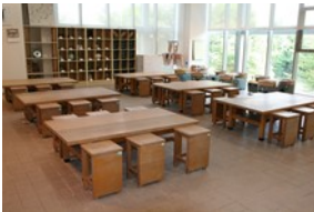
陶磁器の制作ができる実習室