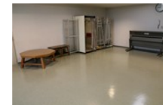
絵画制作のための実習室