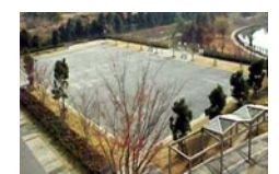
軽スポーツに利用可能なグラウンド