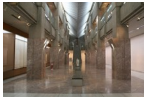
絵画、写真、書道等の展示に最適