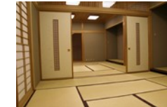
茶道や華道等に最適な和室の研修室