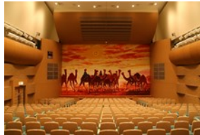
発表会(演奏会)や講演会等に最適