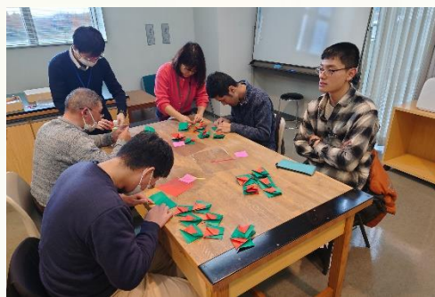
芸術教室 リースの作成途中です