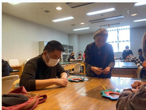
芸術教室 濱田先生と一緒に折ります

いずれもレベルの高いことに挑戦し、見事に成功させており、充実した時間を過ごしました。