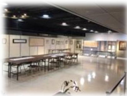
↑香久会作品展の様子